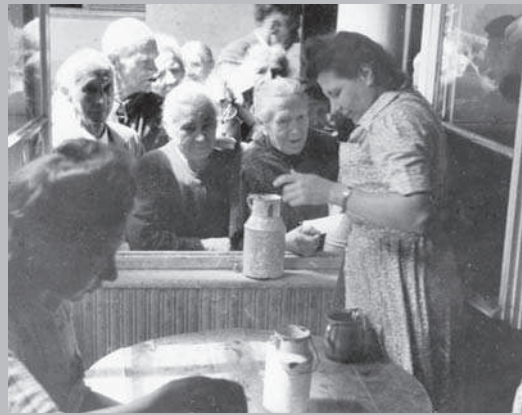
Suppenküche beim Ev. Gemeindedienst