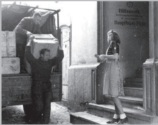
Ankunft von Auslandsspenden beim Evangelischen Hilfswerk Pfalz in Speyer, ca. 1947.