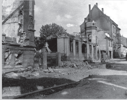
Straßenzeile in Pirmasens.