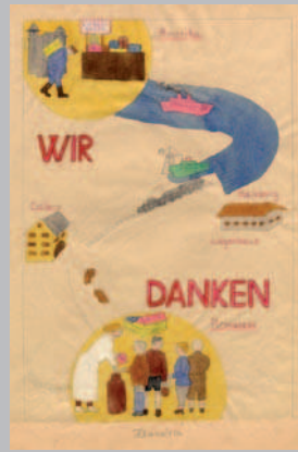
Dankschreiben von Kindern aus Pirmasens an Spender in USA, 1947.