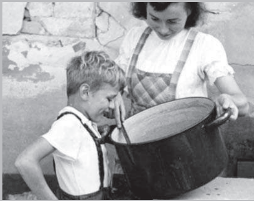
Kinderspeisung in Dörrenbach [1948].