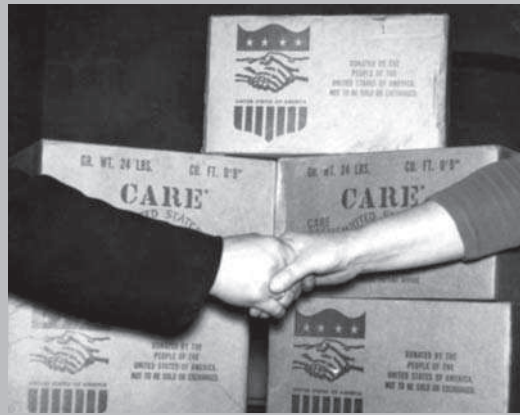
CARE-Pakete beim Hilfswerk in Speyer, um 1947.