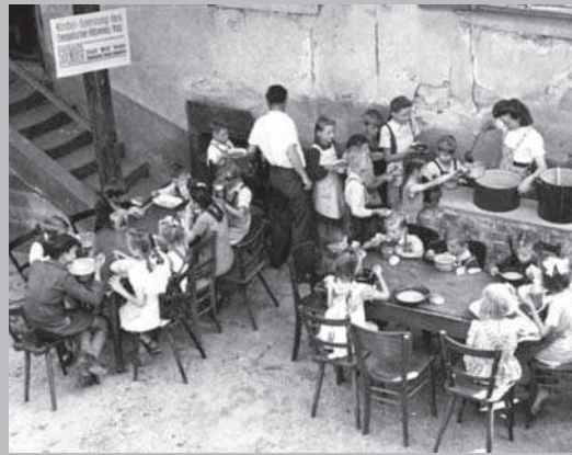
Kinderspeisung in Dörrenbach [1948].