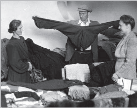
Kleiderausgabe in Pirmasens, Juni 1947.