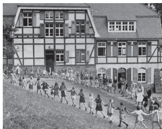
oben: Kinderspeisung in Ramsen, 1947. unten: Kindererholung in Ramsen, 1947.