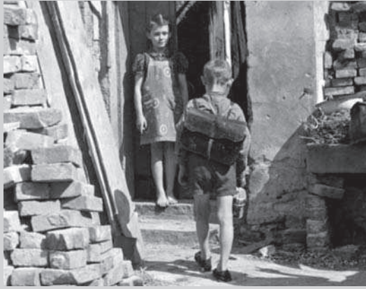
Wohnen in zerbombten Häusern.