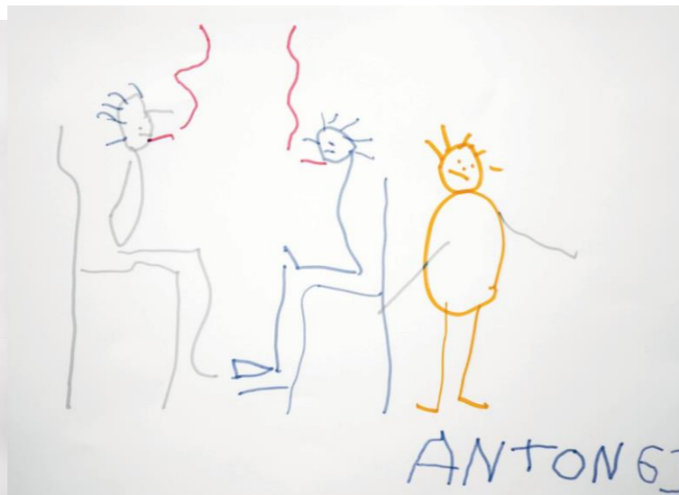
Anton (6) – o.T.