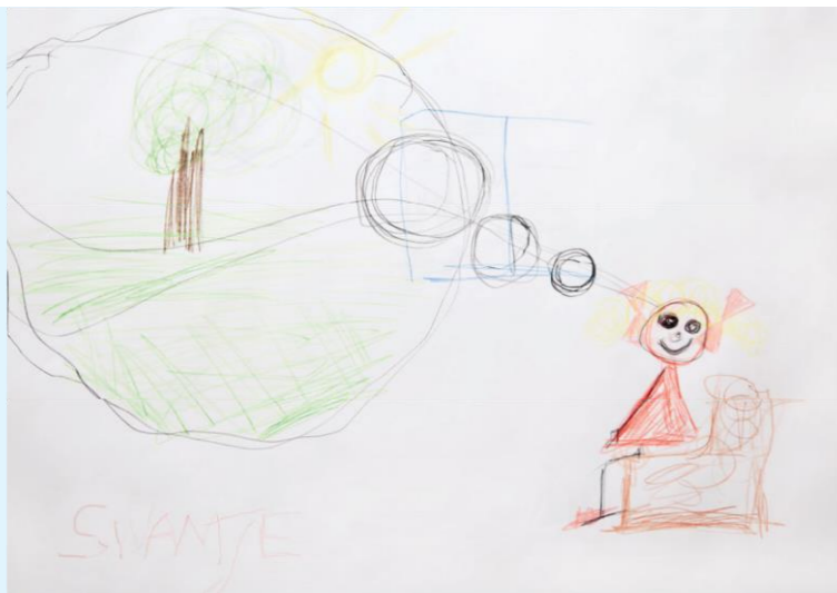
Thomas – o.T.