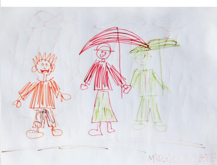
Markus Scheller (6) – „Regenwetter“