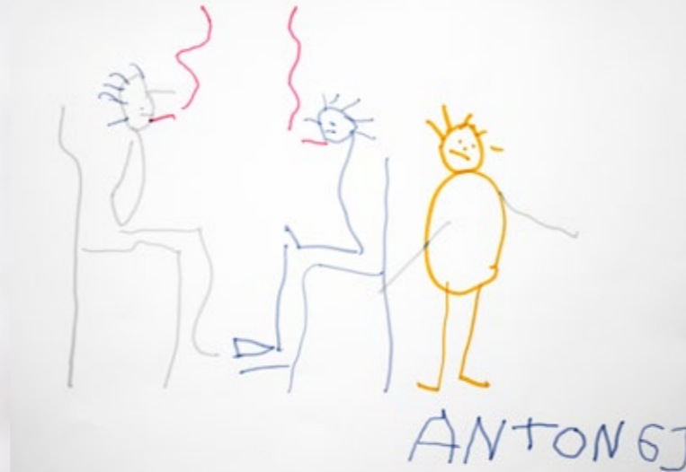
Anton (6) – o.T.