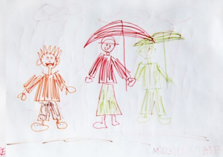
Markus Scheller (6) – „Regenwetter“