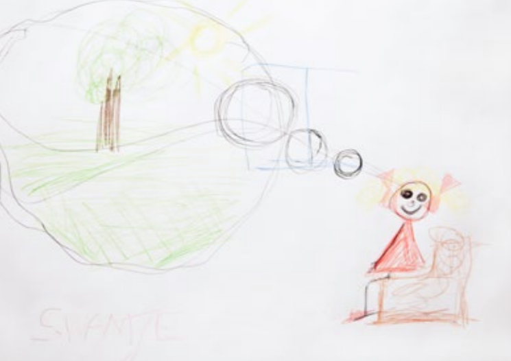
Thomas – o.T.