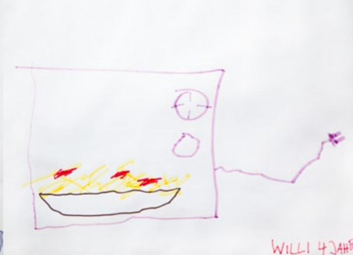
Willi (4) – o.T.

Kinder brauchen eine ausreichende Versorgung.