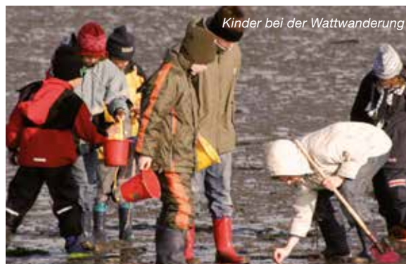
Kinder bei der Wattwanderung